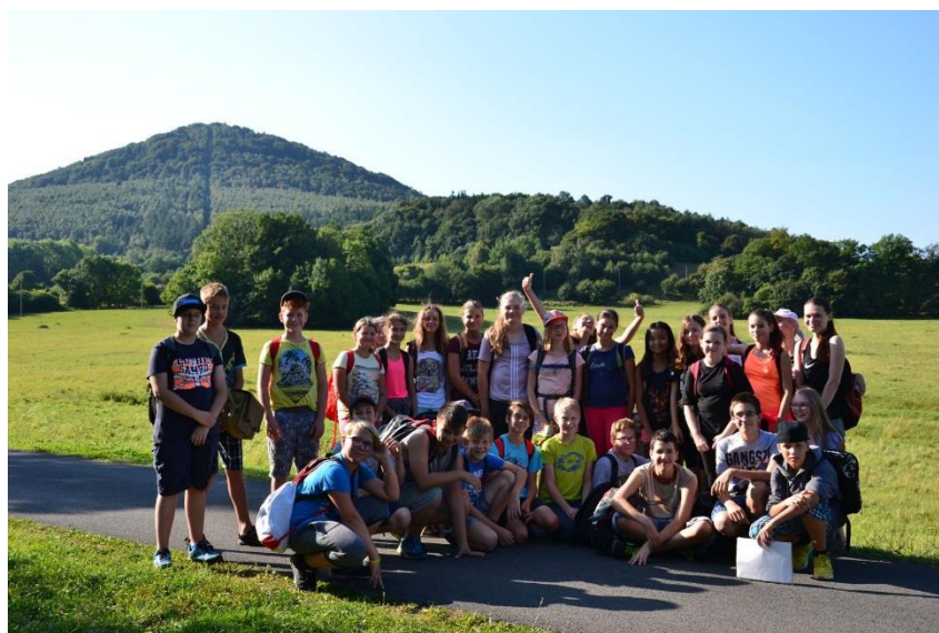
Výlet na Milešovku