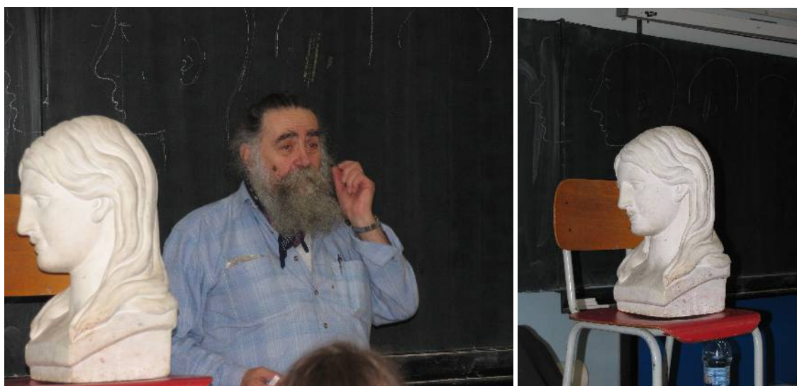
Kamil sopka a antický vzor krásy.

Pro mě to je něco úžasného, chtěla bych to umět. Je to něco krásného, podle toho jsem si začala všimnat víc rysů kamarádu a přátel.