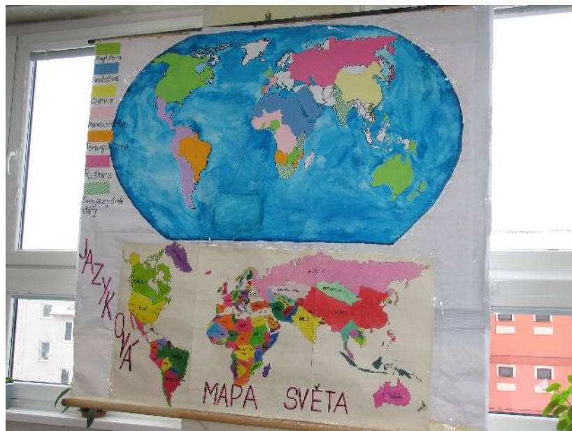
Jazyková mapa světa