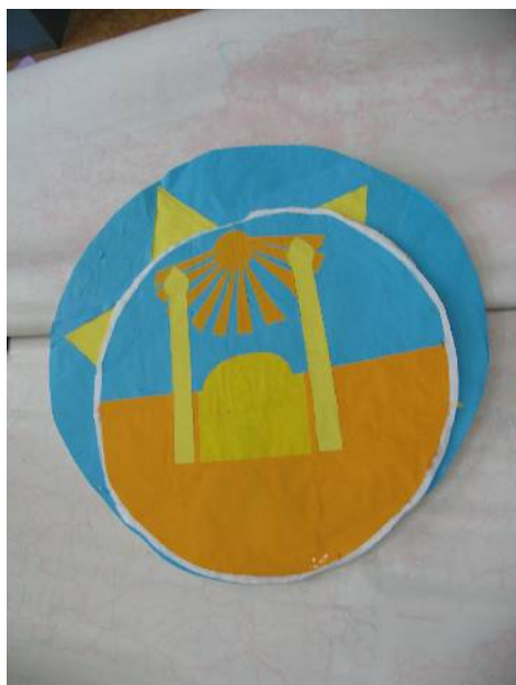
Filozofie a náboženství