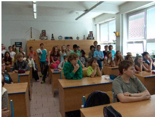
Rasismus a rozdíly mezi námi ... kultura