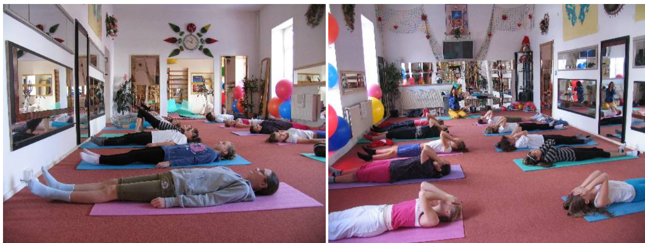
Jóga, relaxace a meditace