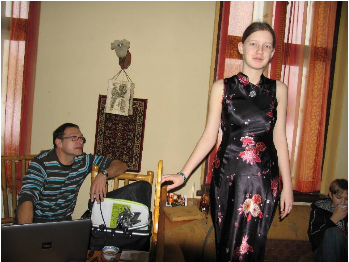
Pan Jarďa nam vypravel i o narodnim odevu a ukazoval spoustu fotografi.