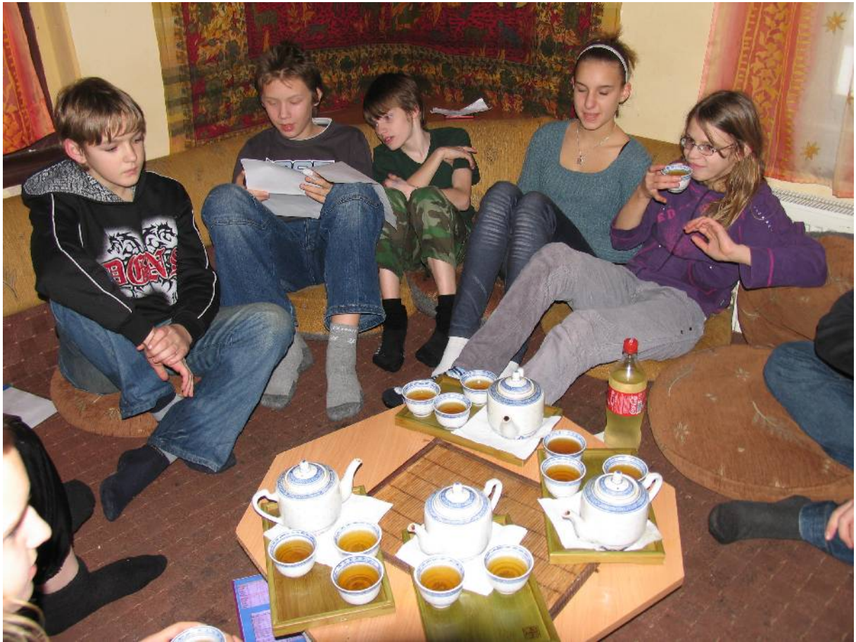
Během ochutnávek a přednášek přišel čas i na naše referáty o Vietnamu.