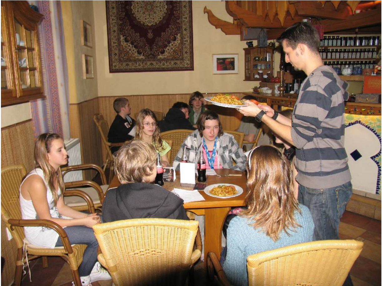
Po dlouhém přednášení jsme se všichni těšili na oběd, který byl opět ve stylu Vietnamu...