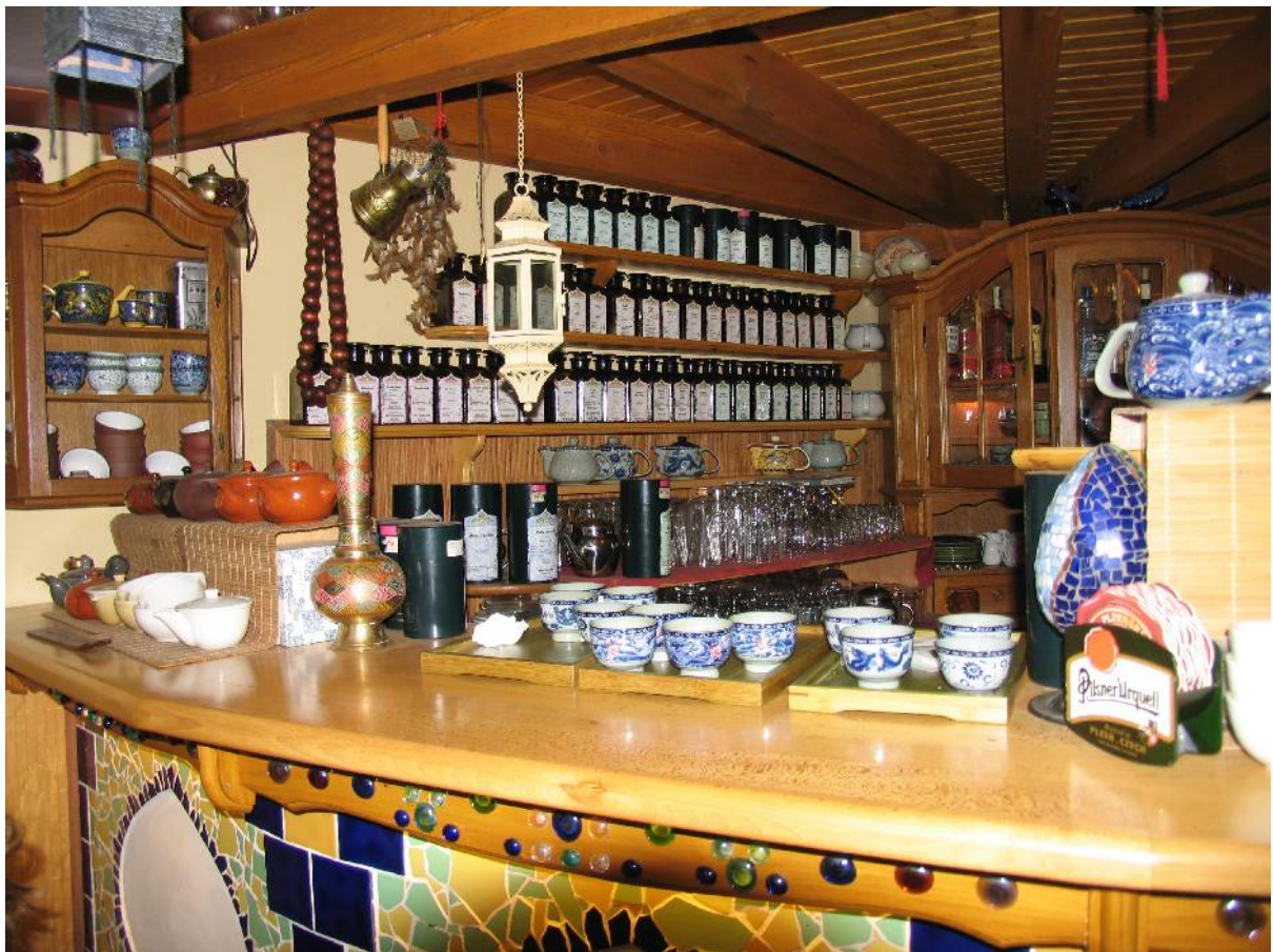
Uvnitř čajovny je velmi příjemné prostředí, stále jsme se vyptávali a koukali co tu mají.