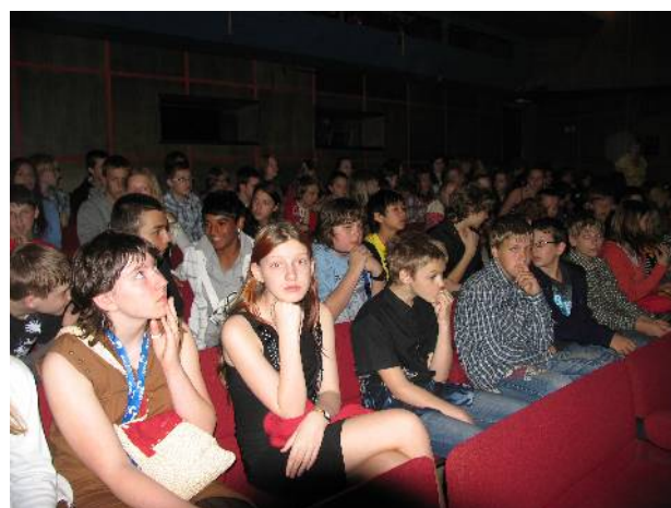
Atmosféra divadla i přestavení byla tajuplná.