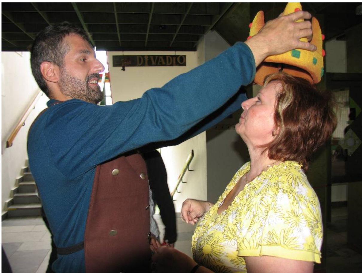
Herci byli za svůj výkon odměněni potleskem a naše paní ředitelka korunována za výborný výběr divadelního představení.