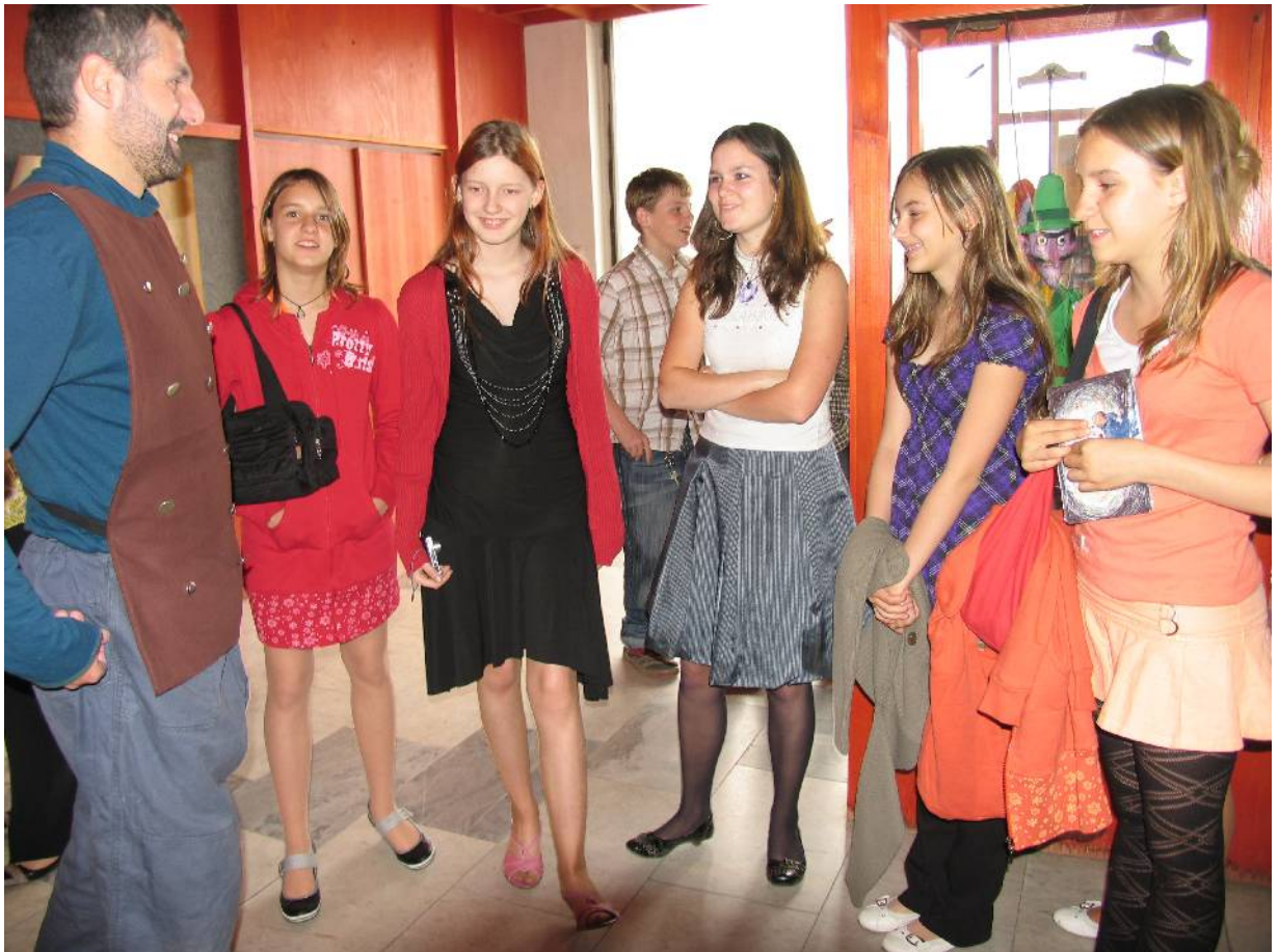
Také vestibul a chodby divadla jsou pěkně vyzdobené ... loutky a kulisy jsou překrásné.