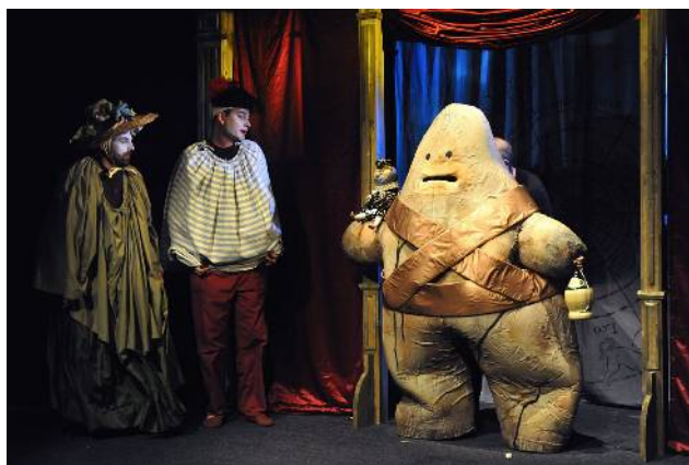
Bylo srandovní, jak golem brečel. První řada byla mokrá. Celé představení bylo hezké.